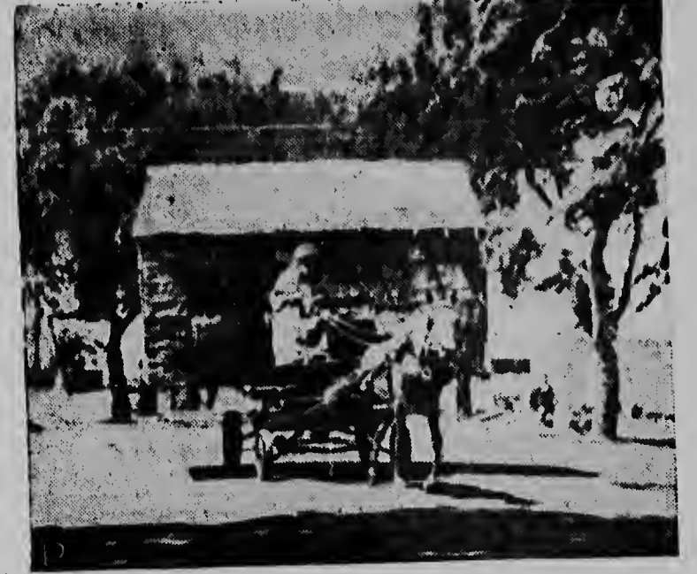
Talrijke inwoners van Casablanca hebben in de afgelopen dagen de vlucht genomen. Hierboven een bewoner, die niet alleen zijn huudeltje heeft ingepakt; hij nam ook zijn gehele huis mee! Geen half werk van deze Marokkaan.